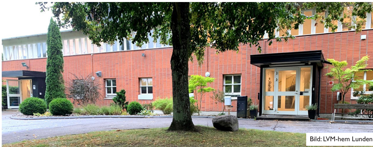
Bild: LVM-hem Lunden

Med bättre anpassade och stödjande insatser är erfarenheten både inom SiS ungdomsvård och missbruksvård att eskalerande utagerande beteenden, med ett ökat antal fysiska ingripanden och beslut om avskiljningar som följd, i hög grad kan undvikas. De anpassningar som utförs på SFA är avgörande för att denna målgrupp ska ha förutsättningar att ta del av den vård som SiS erbjuder.